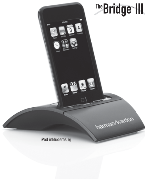
iPod inkluderas ej

The Bridge III är kompatibel med de flesta iPod-modellerna som är utrustade med uttag för dockningsstationer, 4G eller senare modeller, iPhone 3G och iPhone. Video- och stillbildsuppspelning är endast möjligt med foto-och videoutrustade iPod-modeller som klarar av videosökning: iPod classic och iPod nano (3 and 4 generation).